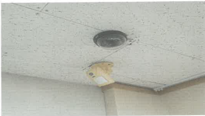
1층 멀티플렉스실 내부 CCTV 교체