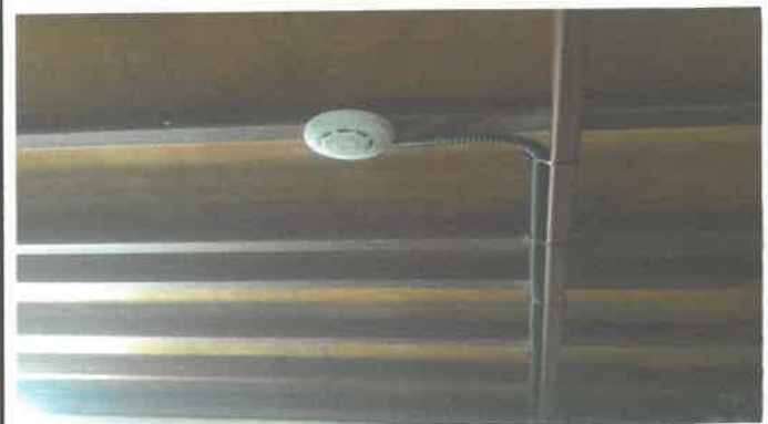
사무공조실 소방 연 감지기 변경교체