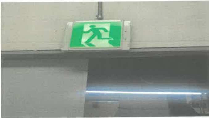
기계 변전실 출입구 유도등 교체