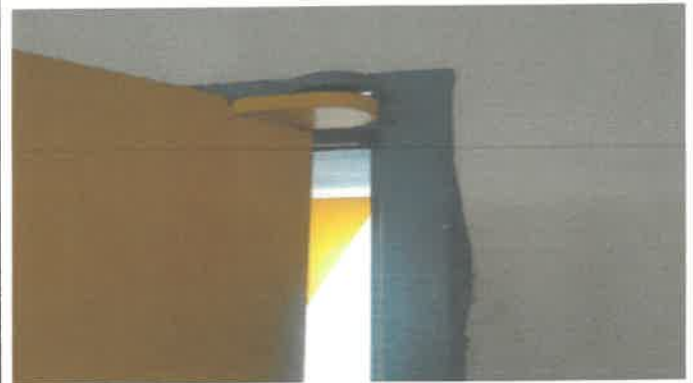
2층 유스2실 출입문 상·하 힌지교정