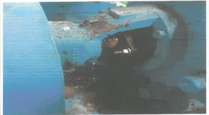
급수펌퍼1호기 바킹교체 및 고정볼트·너트교체