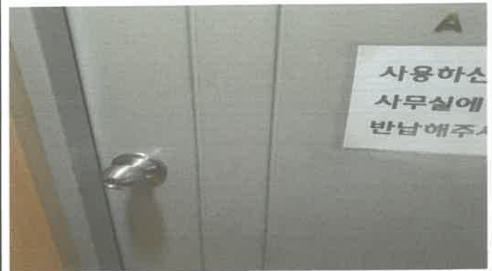
3층 드럼연습 A실 도어락교체