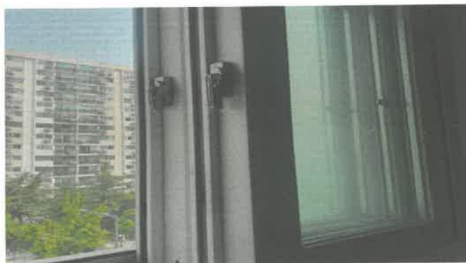
3층 다목적실 창문시건장치 수리