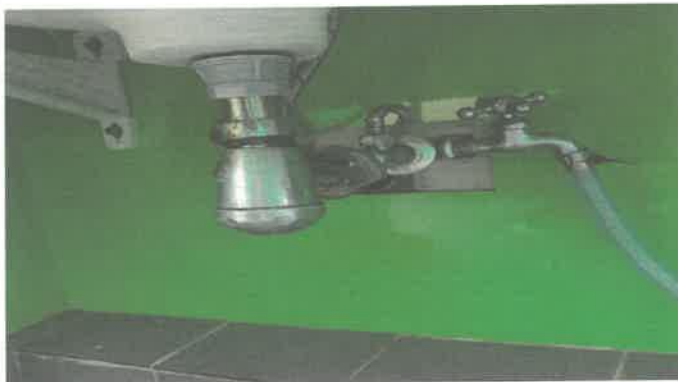
2층 여자화장실 세면대 통수